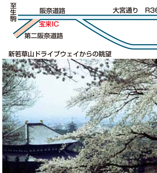
新若草山ドライブウェイからの眺望

見どころや眺望スポットには駐車スペースが確保されています。ゆったり気分で古都を展望するドライブをお楽しみください。